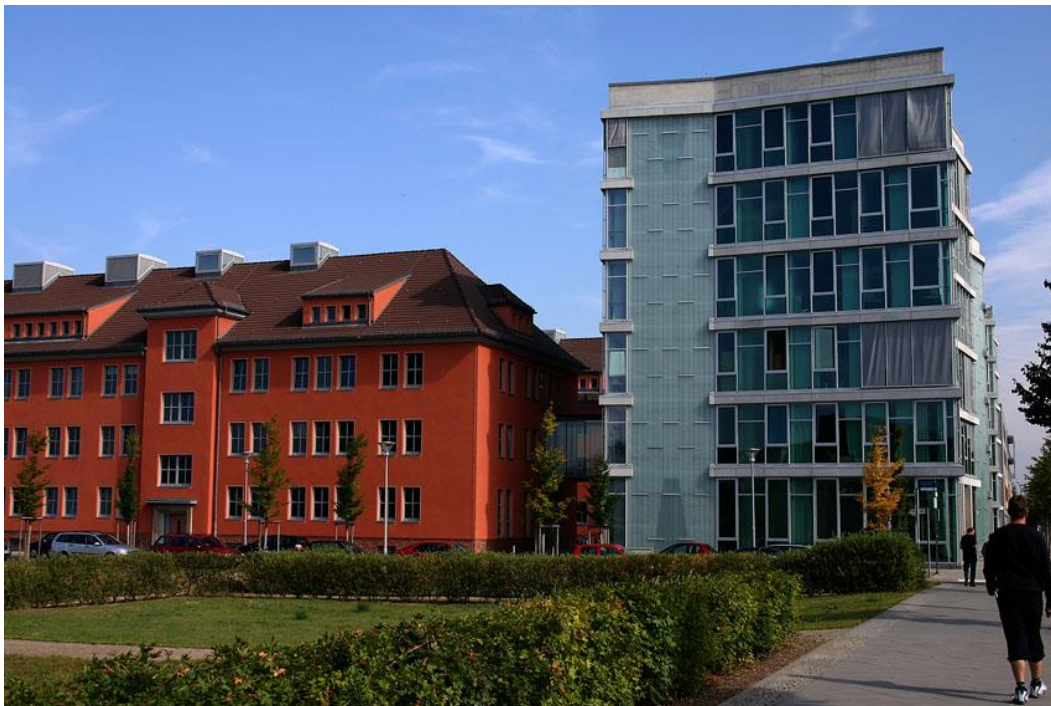
Institut für Psychologie, Wolfgang Köhler-Haus

Auf den folgenden Seiten finden Sie wichtige Informationen, die Ihnen den Einstieg an der Universität erleichtern sollen.